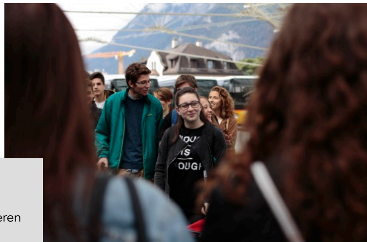
Die Ankunft von den Tessinern Am Bahnhof Chur und das erste Treffen mit dem den Jugendlichen von Chur.

Sommer-Herbst: Der Film wird fertig gestellt und er wird am Filmfestival in Bellinzona „Castellinaria“ präsentiert.