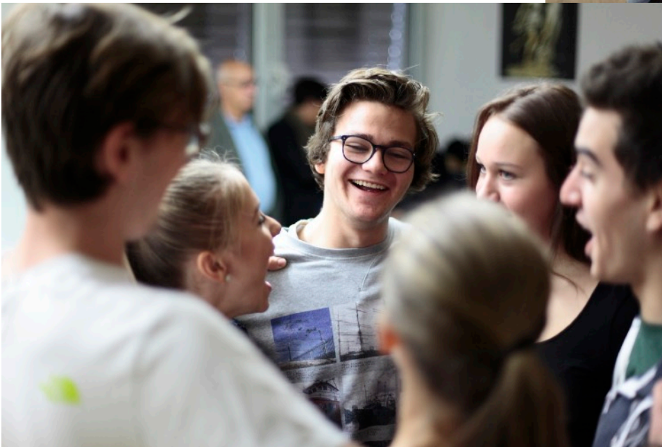
Die Este Woche hat gut angefangen. Fine Freundschaft beginnt zu wachsen zwischen den beiden Klassen.

Wir leben in einer Welt, in der die Mehrsprachigkeit unentbehrlich ist. Die Kommunikation ist der Schlüssel für ein Zusammenleben in Frieden und Freiheit. Eine Demokratie funktioniert nur, wenn beide Seiten sich verstehen.