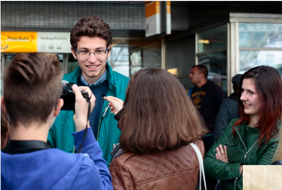
Ein Student von der Kantonsschule von Mendrisio, der interviewet wird von zwei Schülern von Chur.